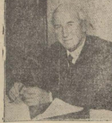
Yeni kabinede (11) Muhafazakâr, (5) Liberal, (8) Amele Fırkası mensubu vardır