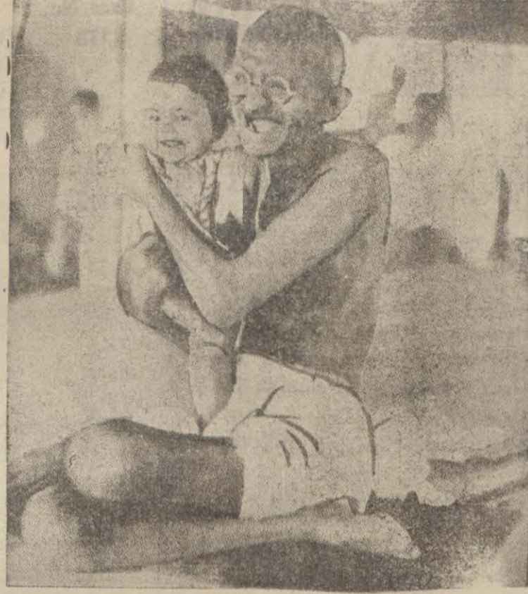
Ganpi, çocukları çok sever

bir kalem kâğıt aldım. İhtiyar kadına şu mealde bir mektup yazdım! —Brightonda tanıştığımız günden beri hakkımda büyük teveccüh gösteriyorsunuz. Bana bir anne şefkati ile bakıyorsunuz. Hatta beni evlendirmeye çalışıyor, genç kızlara takdim ediyorsunuz.