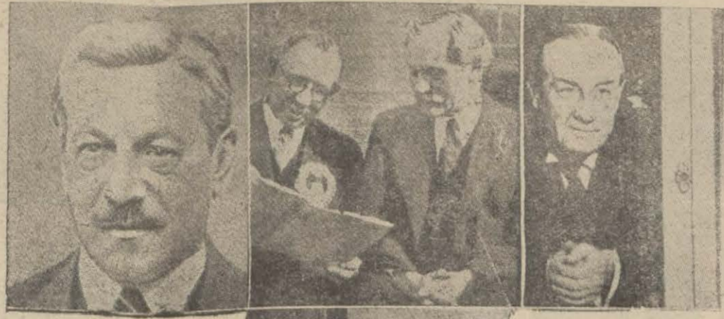
Yeni İngiliz Hükümetinden Simaları Mak Donald, Tomas, Baldwin, Sir Samoel Hor, Sir Çon Simon