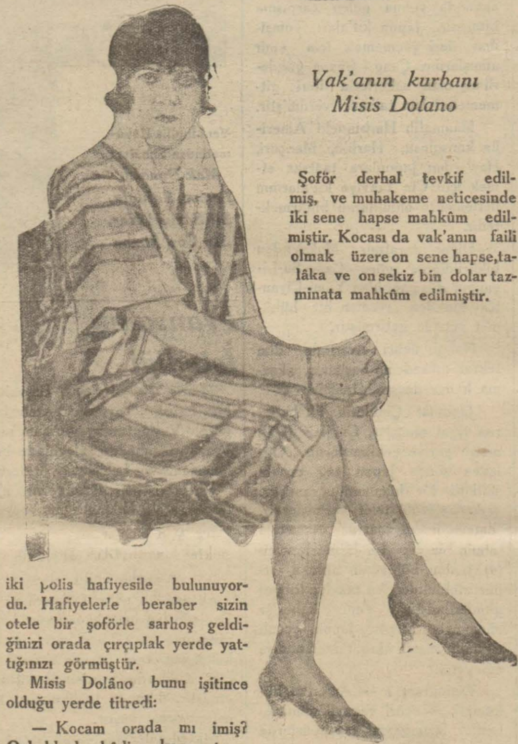
Vak'anın kurbanı Misis Dolano

— Evet kocanızın malûmatı var. Bu hâdise cereyan ettiği gece kocanız da orada bir otele