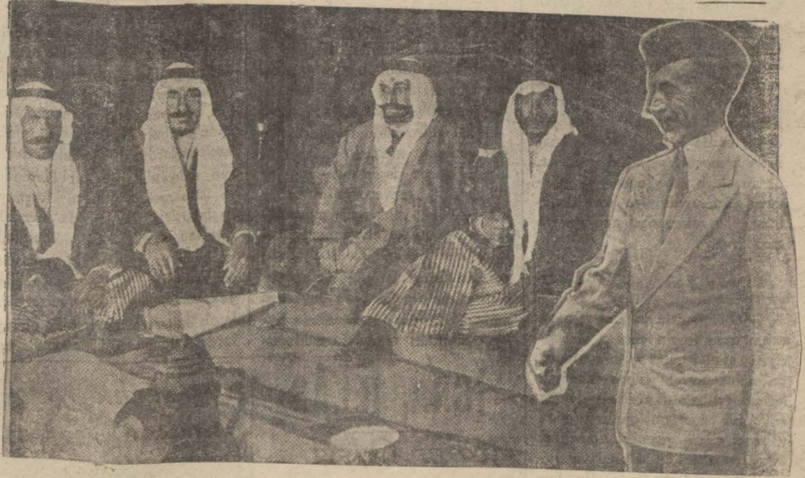
Sultanül Atrâş ve Arkadaşları Irak Kıraltı Faysal Kenarda da